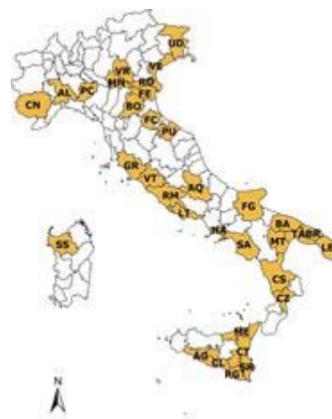
la rete di rilevazione Ismea