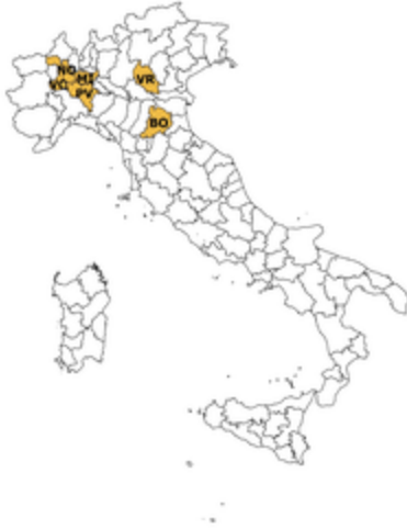
la rete di rilevazione Ismea